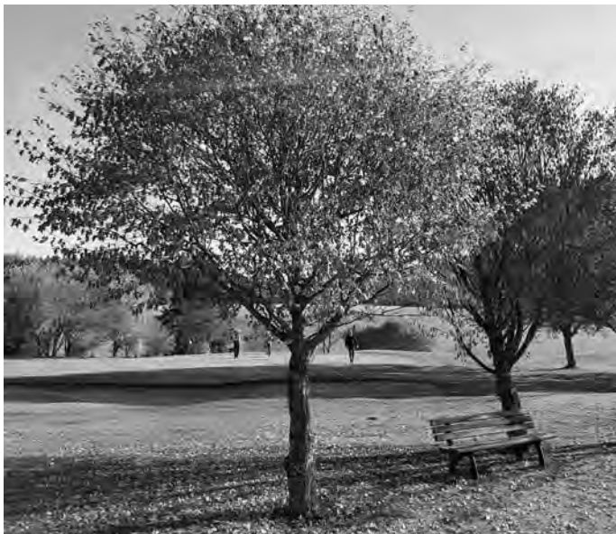
In den schönsten Herbstfarben präsentiert sich derzeit der Platz des GC Reutlingen-Sonnenbühl.